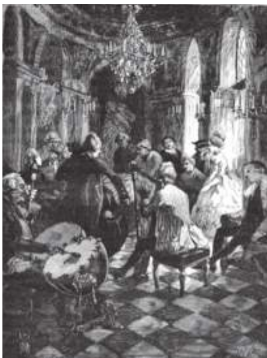
Fig. 2.- Clínica de Mesmer. Siglo XVIII. Dibujo anónimo.

Durante el periodo entre 1760 y 1776, Mesmer fundó un establecimiento en Viena en el que desarrolló su “magnetismo animal” cada vez con más materiales coadyuvantes. A los electrodos, metales y maderas añadió el elemento sonoro, que más tarde se convertirá en principal. En esta etapa trató a varios pacientes con buenos resultados, lo que le llevó a ser muy valorado por el entorno médico de Viena. [Fig. 2]