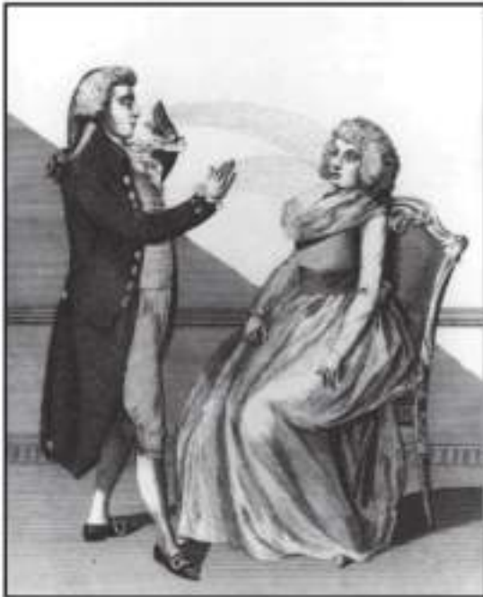
Fig. 1.- Dibujo de Mesmer aplicando quironimia a una paciente. Dibujo s. XVIII. Musée d'Histoire de la Médecine et de la Pharmacie. París.

Mesmer trató enfermedades psíquicas en Eslovaquia, Suabia, Hungría, Suiza y Viena, creyendo en la acción de su método. [fig. 1]