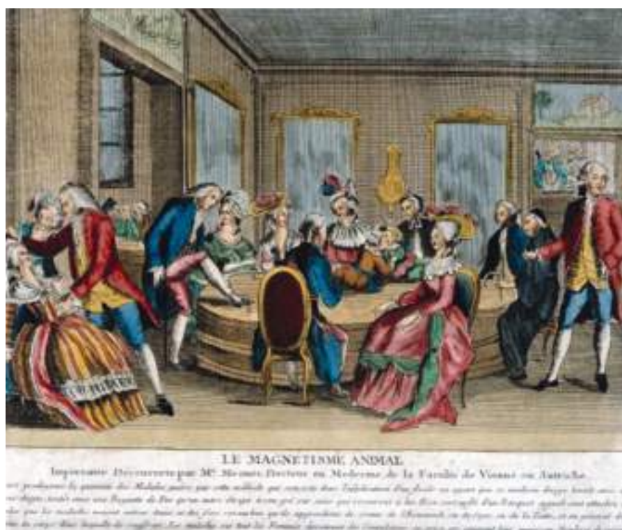
Fig. 4.- Pacientes recibiendo tratamiento en París mediante el «magnetismo animal» de Mesmer. Autor desconocido. Aguafuerte en color (c. 1785).

diciendo: “Es verdad que, sin saberlo él mismo, descubrió algo infinitamente mejor que un nuevo camino: la psicoterapia” 13 .